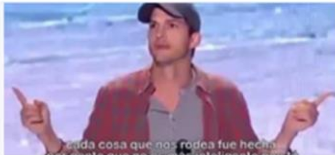
Ashton Kutcher discurso de motivación

El blog me ha permitido aprender entre otras cosas sobre "growth hacking", marketing online, SEO y posicionamiento en Youtube, inbound marketing y creación de contenidos.